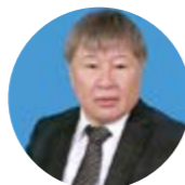
Iain Watt Международный эксперт в сфере издательства и литературы