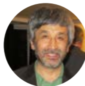
Hamid Ismailov Писатель, глава BBC Central Asia